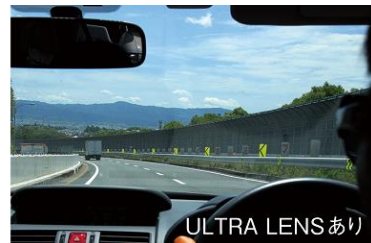
ULTRA LENS あり