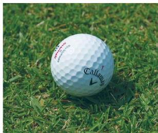
ULTRA LENS あり