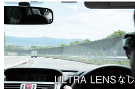
ULTRA LENS なし