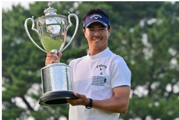
優勝時の石川遼プロ

石川遼プロのツアー優勝は2016年8月のRIZAP・KBCオーガスタ以来、3季ぶりで通算15勝目となります。石川プロは2008年、16歳での衝撃のプロデビューから、ゴルフのラウンド中にSWANSスポーツアイウェアを着用してきました。本大会で石川プロはSPRINGBOK(スプリングボック)フレームに、石川プロと共同開発した裸眼よりも演色性・コントラストを向上させ、ゴルフボールを見えやすくするレンズ『ULTRA LENS for GOLF』を、可能な限り光を抑えるスペシャル形状で装着したモデルを着用していました。