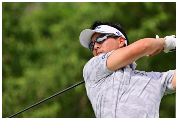
フレーム：SPRINGBOK レンズ：ULTRA LENS for GOLF (シルバーミラー×ウルトラアイズブルー)

もちろんティーショットで飛んでいくボールが追いやくなる、アンジュレーションが見えやすくなるという効果もありますし、当日は日差しも強かったので目の疲れ度合いが軽減されるというメリットもありました。レンズも暗くないので目が慣れる時間がかかりませんし、今回のような長丁場で日差しの強さが時間帯で変わっても着用できる明るさであることも使いやすさの点です。