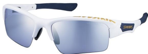
R.I. LIMITED 2019 (1000本限定発売)

石川遼プロが着用するSPRINGBOK(スプリングボック)スペシャルカラーにULTRA LENS2種類がセット