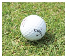
ULTRA LENS なし

ゴルフ用とドライビング用に開発された2種類のULTRA LENS(ウルトラレンズ)がセットになった限定モデルです。