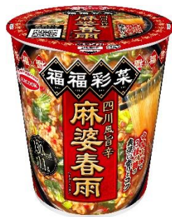
四川風旨辛麻婆春雨