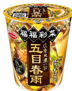
広東風濃い旨五目春雨

「福福彩菜」は、これまでの春雨の“MILD”なイメージを覆す、ガッツリ濃い味わいで白米に合う“WILD”系春雨であるにもかかわらず、他カップめん ※ と比べてカロリー約 1/2 という、今までにない「新・本格中華のカップ麺」です。