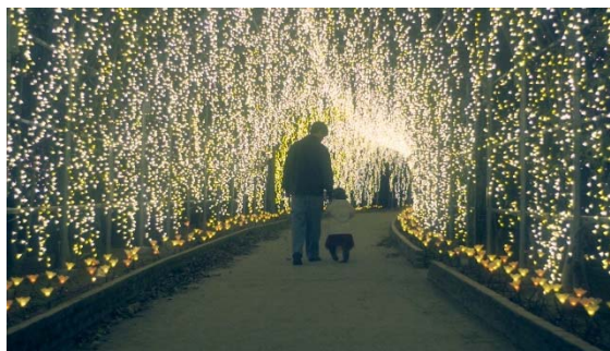
▲あしががフラワーパークで寄り添う2人