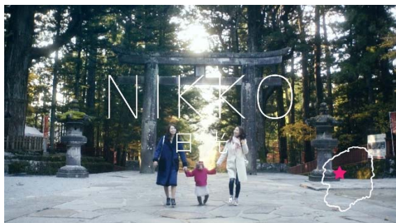
▲日光東照宮で手をつなぐ3人