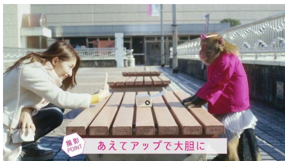
▲上手に撮るためのポイントを紹介