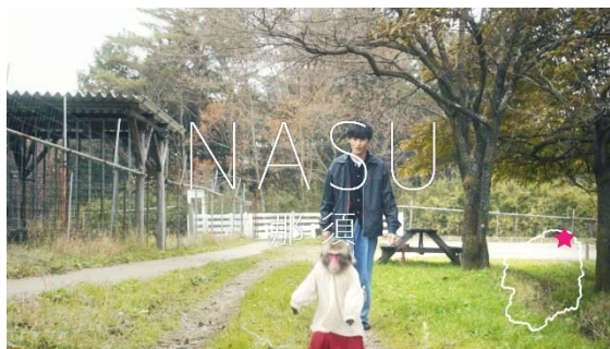
▲那須アルパカ牧場を歩く2人