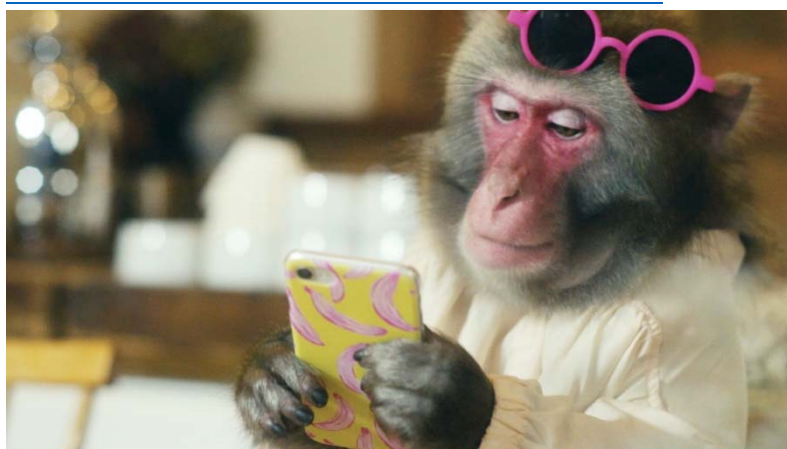
▲スマホでベストショットを狙うトッチー