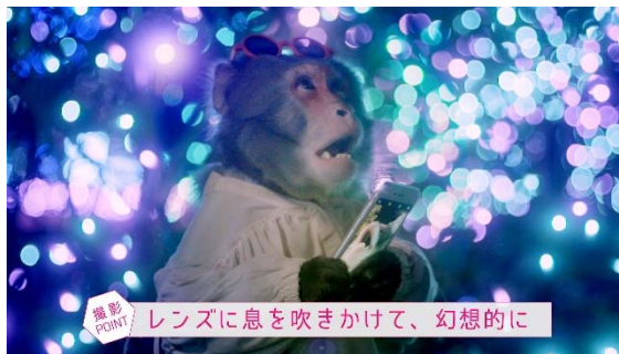
▲上手に撮るためのポイントを紹介