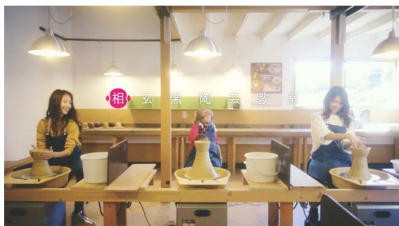
▲益子町のろくろ体験を楽しむ3人