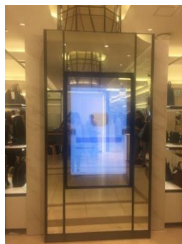
スマートミラー2045 の設置イメージ