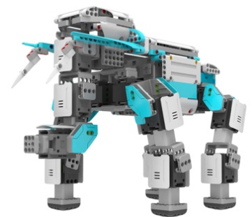
Jimu robot Inventor Kit

※スター・ウォーズとそれに関する製品・サービス名等は日本国及びその他の国における Lucasfilm Ltd. とその関連会社および© & TM Lucasfilm Ltd.の登録商標または商標です。