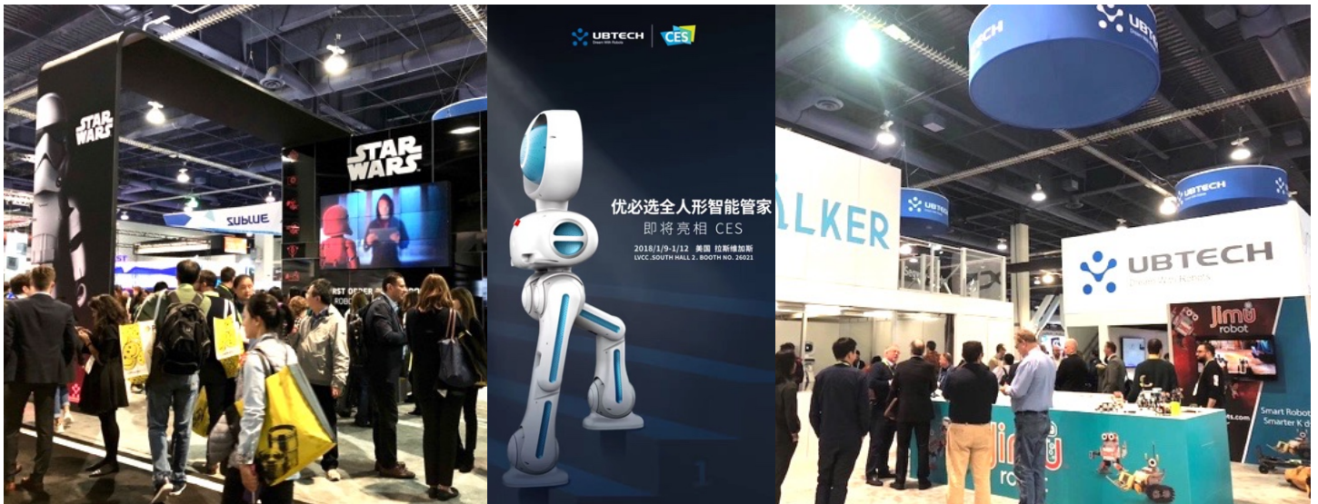
中央：CES2018 にて発表した Walker

AI の研究開発、製品化において世界をリードするロボットメーカー UBTECH Robotics Corp. が、アメリカラスベガスにて開催された、世界最大の家電市 CES (セス) CES にて、「First Order Stormtrooper」を含む、知的ヒューマノイドロボットを展示、多くの方々にご来場頂きました。