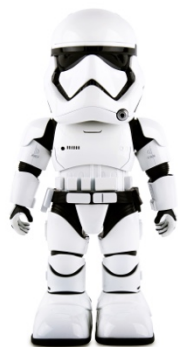
First order Stormtrooper