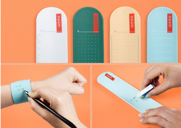
腕に書くより wemo にメモする！

Amazon におけるオンライン販売のほか、東急ハンズ、ヨドバシカメラ、ビックカメラでもお取り扱いがございませう。