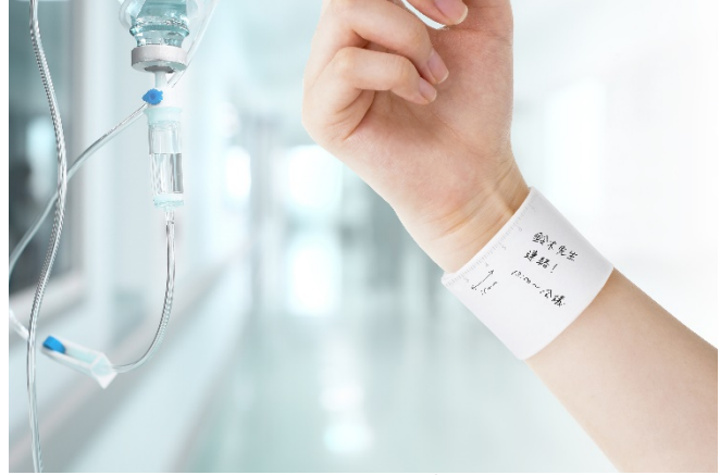
看護師さんの愛用者も多い wemo 医療現場でも活躍するバンドタイプ