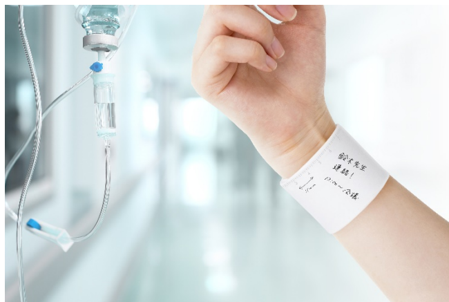
医療現場でも活躍するバンドタイプ