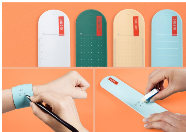
腕に書くより wemo にメモする !

Amazon におけるオンライン販売のほか、東急ハンズ、ヨドバシカメラ、ビックカメラでもお取り扱いがございます。