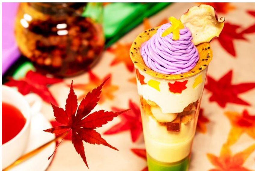
秋の『レイヤード・パフェ』

東京の躍動感や波長と共鳴し、五感を魅了する数々のこだわりでお客様をお迎えする「メズム東京、オートグラフ コレクション」(港区海岸1-10-30/総支配人 生沼久)16階バー&ラウンジ「ウイスク」では、季節ごとに異なる味わいが人気の『レイヤード・パフェ』に秋の始まりを告げる新作が登場！紫芋・紅あずま・みたらし団子・柚子・抹茶など、秋の味覚をぎゅっと詰め込んだ秋風薫る至福のパフェは、2022年9月1日(木)～11月30日(水)の期間限定にて販売いたします。