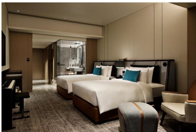
チャプター1 ツイン (ご宿泊部屋)

・Bluetooth® ワードマークおよびロゴは、Bluetooth SIG, Inc.が所有する登録商標であり、カシオ計算機株式会社はこれらのマークをライセンスに基づいて使用しています。