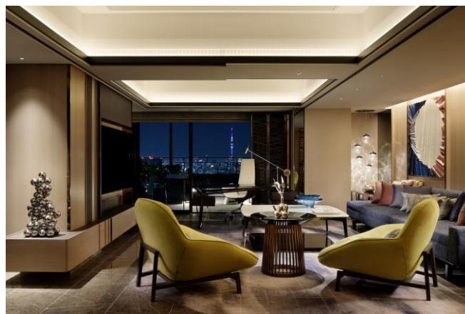
チャプター4 스위트 リュクス (ピアノレッスン場所)