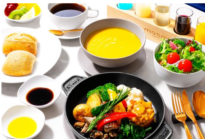
野菜を中心としたメインディッシュ

東京の躍動感や波長と共鳴し、五感を魅了する数々のこだわりでお客さまをお迎えする「メズム東京、オートグラフ コレクション」(港区海岸 1-10-30/総支配人 生沼久)は、2022年7月11日(月)より、16階のフレンチレストラン「シェフズ・シアター」で提供している朝食メニュー『メズム・ブレックファスト』を、メインディッシュが選べるセミbuffスタイルへリニューアルいたします。