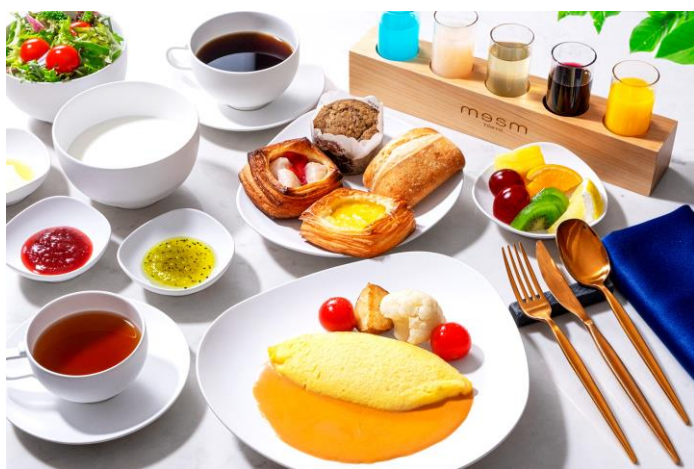
オムレツ&コンソメスープ