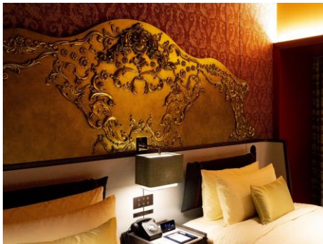
舞台装飾から着想を得たデザインのヘッドボード