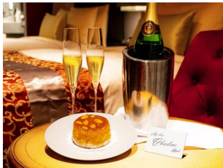
ウェルカムスイーツ&スパークリングワイン