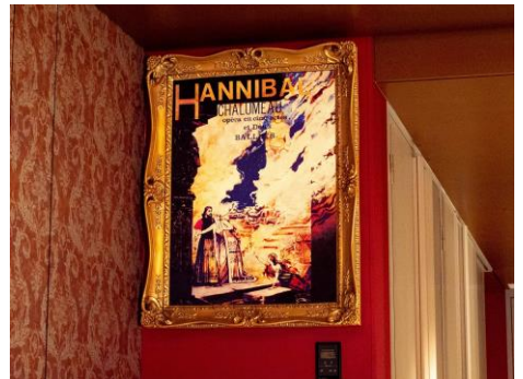
劇中劇「ハンニバル」の額入りポスター