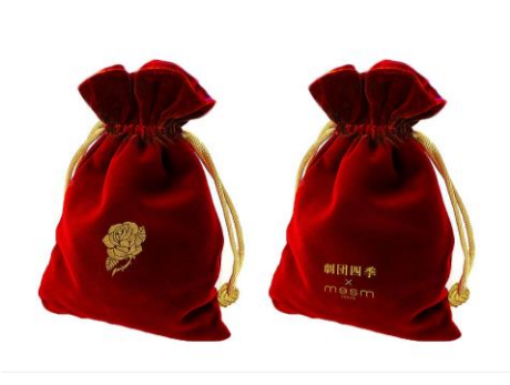
アメニティポーチ(非売品)