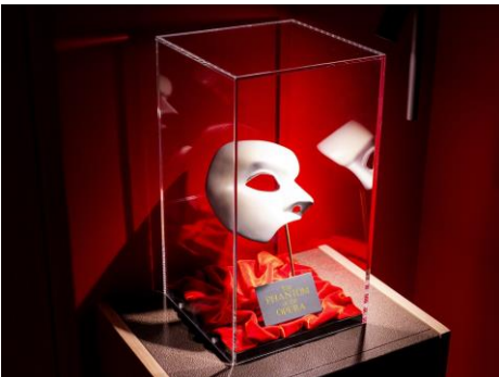
怪人の仮面の展示