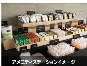
アメニティステーションイメージ

タッチパネル式の手続きでスマートにチェックインとチェックアウトが可能です。J R ホテルメンバーズ会員のお客さまはさらにスムーズに、より短時間でチェックインができます。チェックアウトの追加精算も全てワンストップで素早く完了できます。