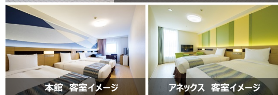
本館 客室イメージ