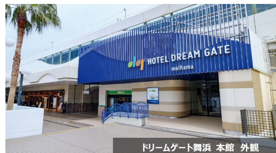
ドリームゲート舞浜 本館 外観