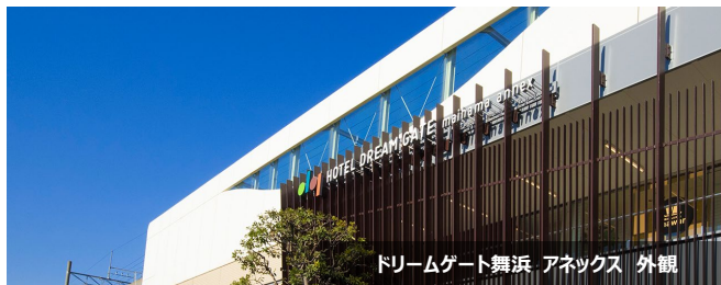
ドリームゲート舞浜 アネックス 外観

駅に直結した立地のため、改札を出てすぐにお越しいただけます。また特殊な建築構造により、駅直下にあるホテルにもかかわらず静かにぐっすりお休みいただけます。