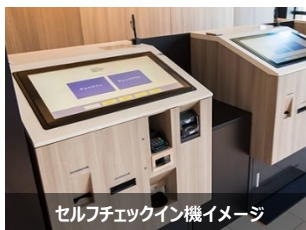
セルフチェックイン機イメージ