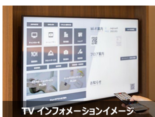
TV インフォメーションイメージ

アメニティグッズをロビーで自由に選べるサービスです。お客さまの必要なアイテムを必要な分だけお持ちいただくことで、廃棄するアメニティを減らすことができる環境負荷の少ないサービスです。入浴剤や化粧水、足指パッドなど充実したラインアップでリラックスタイムをお楽しみいただけます。※詳細は『別紙 2』参照