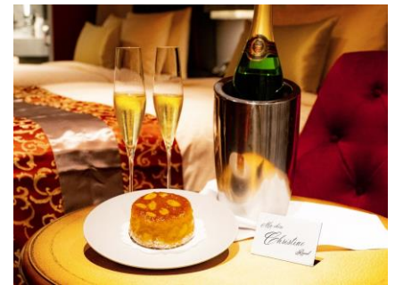
ウェルカムスイーツ&スパークリングワイン