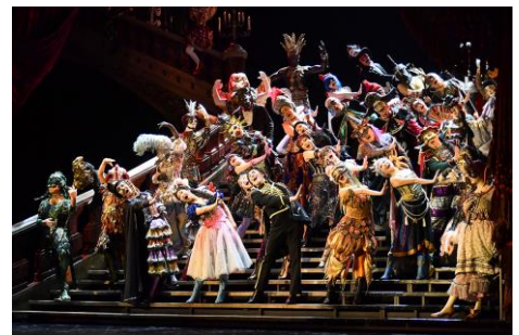
『オペラ座の怪人』

JR 東日本四季劇場[秋]のこけら落としを飾った『オペラ座の怪人』は、フランスの作家ガストン・ルルーの同名小説を基にしたミュージカルです。パリ・オペラ座の地下に棲み、歌姫クリスティーヌに恋をする“怪人”。その彼の悲しいまでの愛の様が、“21 世紀のモーツァルト”アンドリュウ・ロイド＝ウェバー(『キャッツ』、『エビータ』他)の流麗で重厚な旋律によって紡がれます。1986 年ロンドン開幕以来、世界中で上演されており、四季においても 1988 年東京初演以来、総入場者数は 730 万人以上、総上演回数 7000 回以上を誇る、まさに国内屈指のミュージカル作品です。