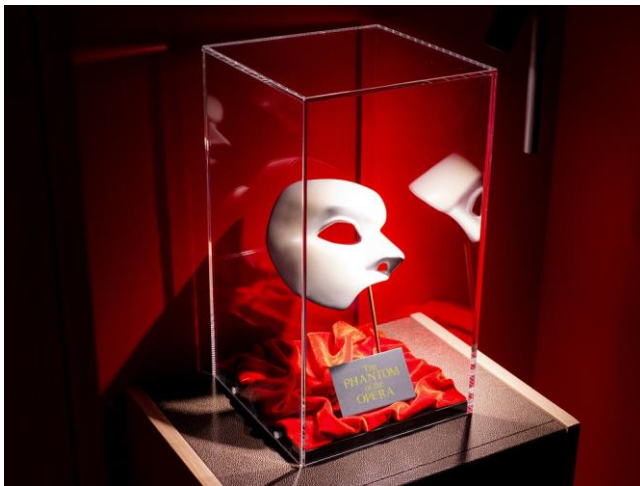
怪人の仮面(レプリカ)