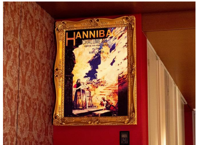
劇中劇「ハンニバル」の額入りポスター