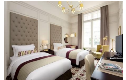
パレスサイドスーペリアツイン

高い天井と縦長窓にヨーロッパクラシックが調和する、エレガントで居心地の良い客室です。窓外に広がるのはダイナミックに移り変わる、東京の中心・丸の内の街並み。喧騒から離れた静けさの中、オリジナルのアメニティがホテルストーリーへと誘います。