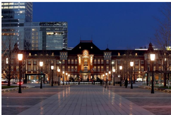
東京ステーションホテル

※「 もっと楽しもう！TokyoTokyo 」の割引は、当社の宿泊事業者登録が完了次第適用します。