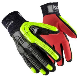
Rig Dog™ Xtreme / Cold Protect