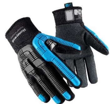
Rig Dog™ Waterproof