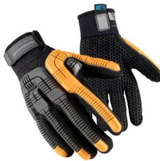
Rig Dog™ Mud Grip