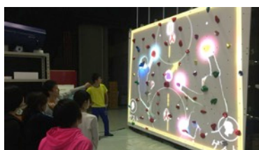
オーグメンテッドプロブレムズ < Augmented problems > 他人や自分が作った オリジナルルートを制覇する