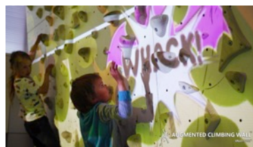
ワックアバッド < Whack-A-Bat > 「ボルダリング」×「モグラ叩き」