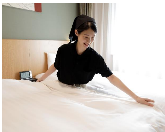
客室のオープン前準備(イメージ)