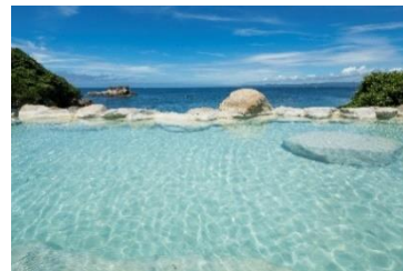
『浜千鳥の湯 海舟』混浴露天風呂