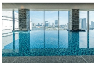
最上階の屋内プール

『ラビスタ東京ベイ』公式 WEB サイト: https://www.hotespa.net/hotels/la_tokyobay/