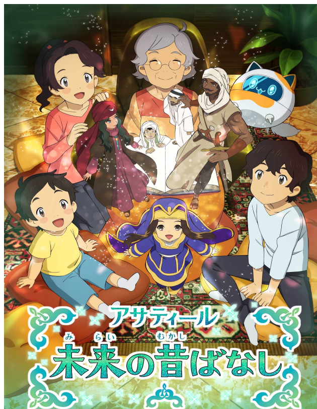
『アサティール未来の昔ばなし』ポスター

『アサティール未来の昔ばなし』は、時は近未来の2050年、アラビア半島に伝わる昔ばなしをサウジアラビアの首都リヤドを舞台に主人公の「アスマお婆ちゃん」が3人の孫たちにやさしく導くように語るアニメ物語です。各エピソードを23分にまとめ13話のエピソードで放送します。ストーリー主役の「アスマお婆ちゃん」を演じるメインキャストは、アニメ『ゲゲゲの鬼太郎』や『ドラゴンボール』で活躍する野沢雅子さん。同アニメは監督に下田正美氏を起用しサウジの民話を近未来風に作り上げました。制作はマンガプロダクションズと東映アニメーション株式会社(東京・中野区)が共同で行いました。