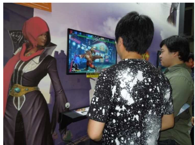
右: 二人一組でゲーム対戦