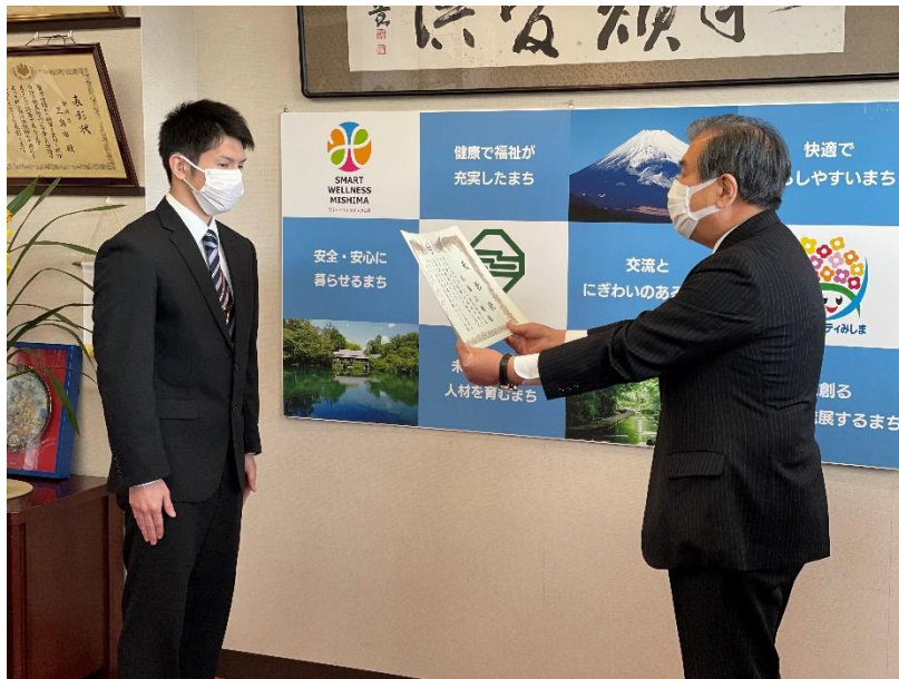
豊岡市長から表彰状と記念の盾が贈られました