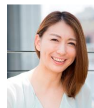
小椋 久美子さん （バドミントン）