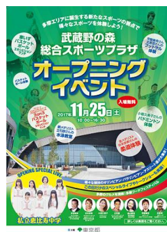
ポスタービジュアル

なお、本イベントには小池知事も出席し、オープニングセレモニーへの出席のほか、 シッティングバレーボール体験会（アスリートトークショー等）に参加する予定です。 （当日のご取材に関しましては詳細が決まり次第、ご案内します。）