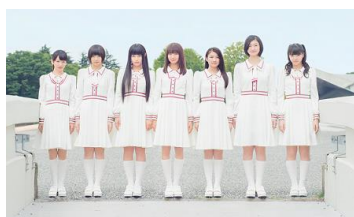
私立恵比寿中学 （アイドルグループ）