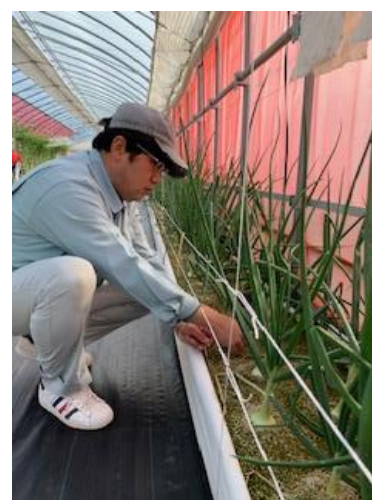
(ハウスコムファームでの作業の様子)