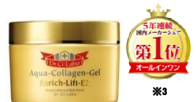
アクアコラーゲンゲル エンリッチリフトEX 120g ¥8,300(+税)

疑似筋膜**を張るドクターシーラボ独自成分が、ピンと肌を引き締め、さらに、“金のコラーゲンEX*”も配合し、乾燥による小ジワを目立たなくします*5。しかも、化粧水、乳液、美容液、アイクリーム、クリーム、マッサージクリーム、パック、化粧下地の8つの役割を兼ね備えています。あなたの肌でも「結果」を実感してください。