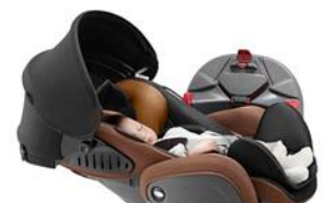
『フラディア エアー』のフレックスシェード STD