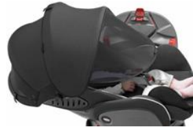
『フラディア エアープラス』のフレックスシェード

日差しから赤ちゃんを守るシェードは、車内での睡眠環境を整えます。角度調節ができ、成長に合わせて長く使えます。取り外しもワンタッチ。紫外線カット率はシェード部分が99%以上、メッシュ部分が80%以上です。