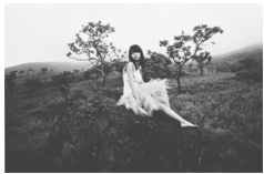
「宮崎あおい 湯布院にて 005」