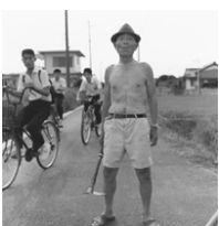
「In the Road by the Vegetable