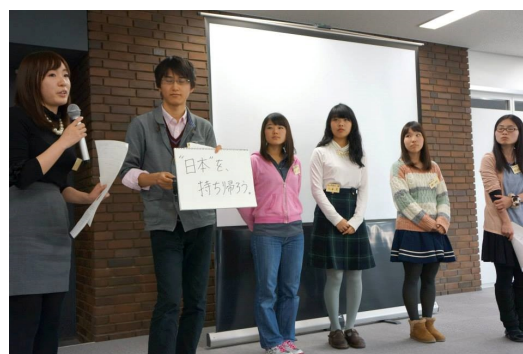
昨年度実施したビジネスコンテストの様子