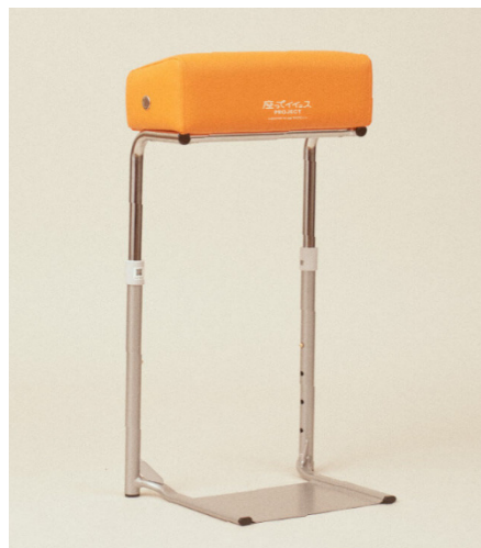
株式会社ダイエーの店舗で「マイナビバイトチェア」に座ってレジをしている様子／「マイナビバイトチェア」