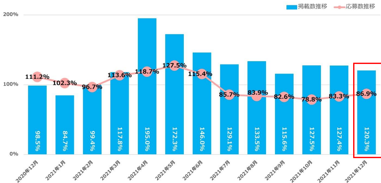
【図 1_2】 <全国>2018 年平均を 100%とした掲載数・応募数の月次推移： 月単位の増減比を明らかにするため算出