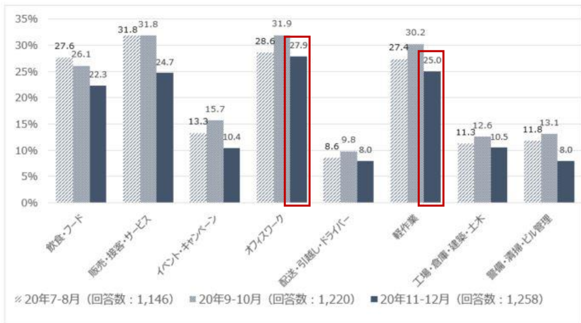
【図4】 非正規雇用の仕事探しをした理由