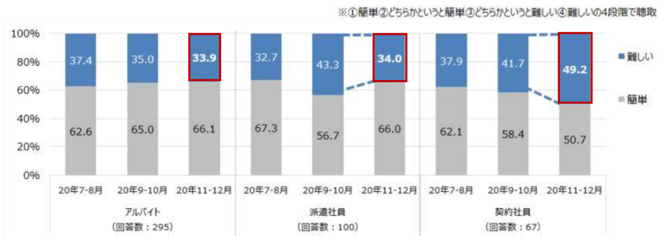
【図6】 非正規雇用（アルバイト、派遣社員、契約社員）の新規就業について