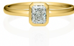
トランク ベゼル リング