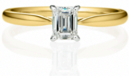
シンシア ソリティア リング