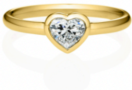
トランク ベゼル リング