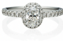
ルシーダ ヘイロー リング