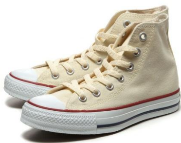
キャンバスオールスターHI

言わずと知れたシューズブランド CONVERSE(コンバース)は、1908年、マーキス・M・コンバースによってアメリカで創立されました。バスケットボールシューズの代名詞でもある「キャンバス オールスター」をはじめ「ジャックパーセル」、「ワンスター」、「ウエポン」等、数々のマスターピースを生み出し、世界中のカジュアルユーザーから愛されています。