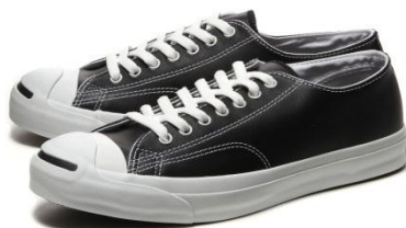
LEA ジャックパーセル