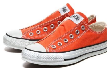
オールスタースリッパ3 OX