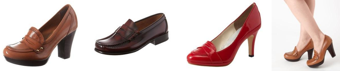
左より あしながおじさん, earth music&ecology, vanity beauty

ベーシックなコインローファーデザインに、コロんとしたフォルムや、味わい深い質感の本革素材など、どこか懐かしくなるような要素がいっぱい！