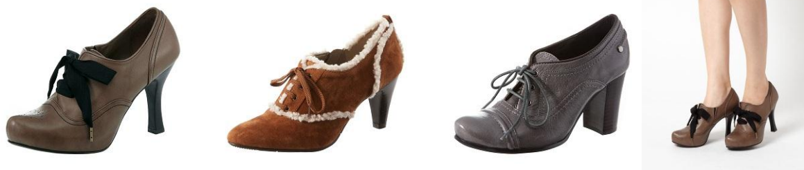
左より VIVA ANGELINA, fed INTERNATIONAL, Fin

全体的にマニッシュな雰囲気メンズライクなデザインになっていますが、女性らしいポイントとのMIXで、華やかな印象に仕上がっています。