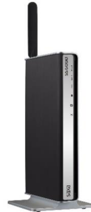
SS6000Pro（据置用品はオプション）