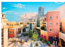
「ラ チッタデッラ」施設外観