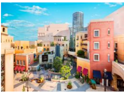
「ラ チッタデッラ」施設外観