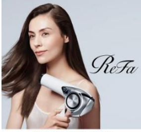
ReFa BEAUTECH DRYER PRO

女性専用の更衣室をご用意しております。ドレッサーも設置しておりますので、運動後のメイクなどにご利用いただけます。