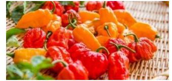
香りと辛味の比較