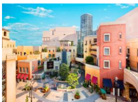
「ラ チッタデッラ」施設外観