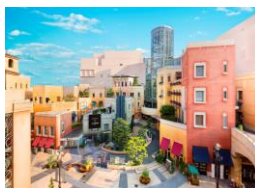
「ラ チッタデッラ」施設外観