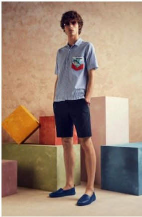
オープンカラー ストライプ ショートスリーブシャツ

このユニークなプリントは、シャツ、Tシャツ、レザーバッグのアクセントとして使用されています。エレガンスとキツチュ、High&Low(上質で高級なものとチープで俗っぽいもの)との融合は、ポール・スミスならではのデザインングネチャーです。