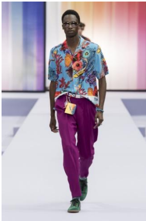
コイハワイアン アロハシャツ