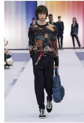
ハワイアン ジャカードニット