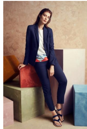
TUNA プリント Tシャツ(ウィメンズ)