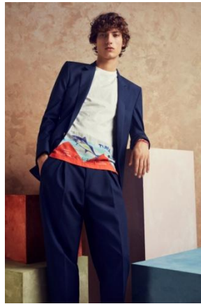
TUNA プリント Tシャツ(メンズ)