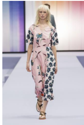
フローラルプリント ドレス