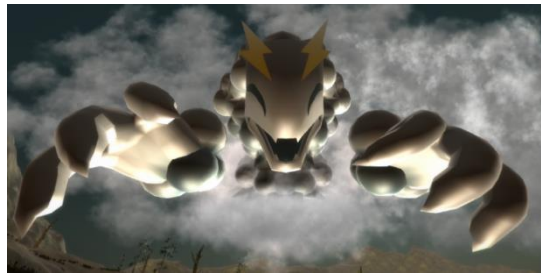
【イメージ図:VRに登場するゲリラ大魔王】

＜イベント詳細＞ イベントの予約はこちらのページのお知らせ欄からできます。 http://pawr.life-ranger.jp/