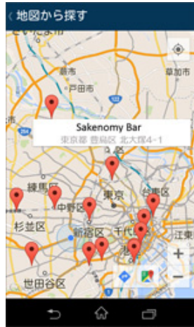
【Android版地図から探す画面 (日本語版)】