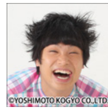
もう中学生「まだ明るい」