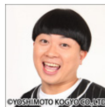
チョコレートプラネット・松尾駿「ジャマイカで発見」