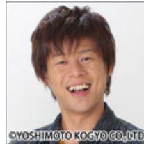
野性爆弾・ロッシェ「かわいい！」