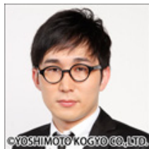
シノンヌ・じろう「訴訟前」