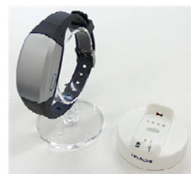
リストバンド型ライフ レコーダー