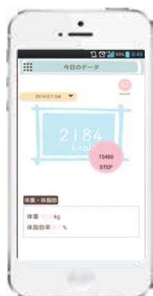
専用アプリ「Cal & Steps」