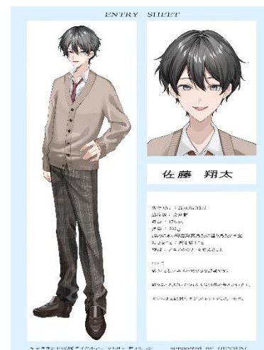
キャラクターシートイメージ