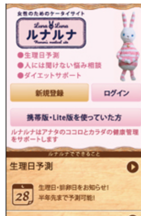
ルナルナ for Web