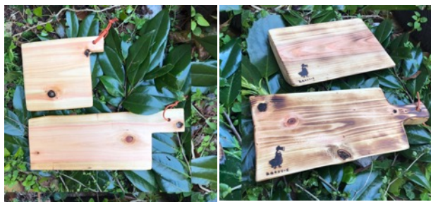
カッティングボード