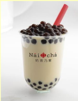
<セイロン オリジナル タピオカミルクティー>