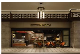
東京ミッドタウン日比谷店