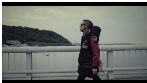
降谷建志／「Prom Night」ミュージックビデオ